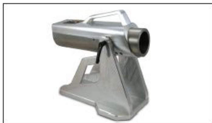
OPTIMALIZOVANÝ VÝSLEDEK Fyzický prototyp vyrobený frézováním.