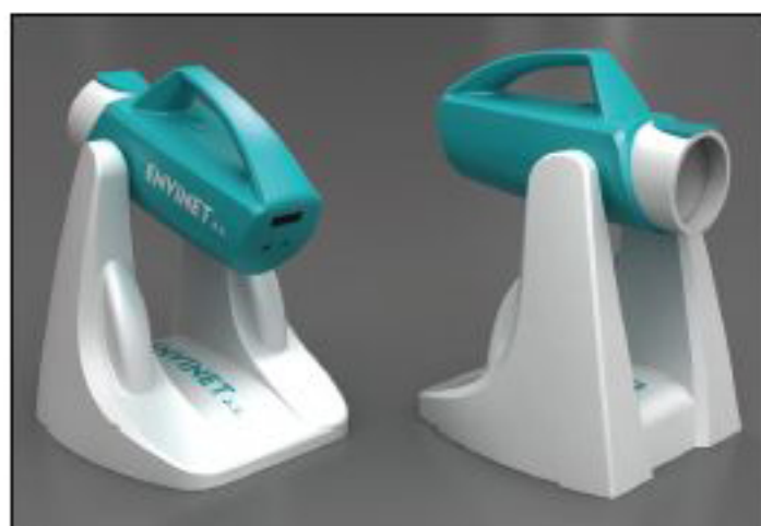
NÁPAD VE VIZUALIZACI Výchozí designová studie jódového detektoru.